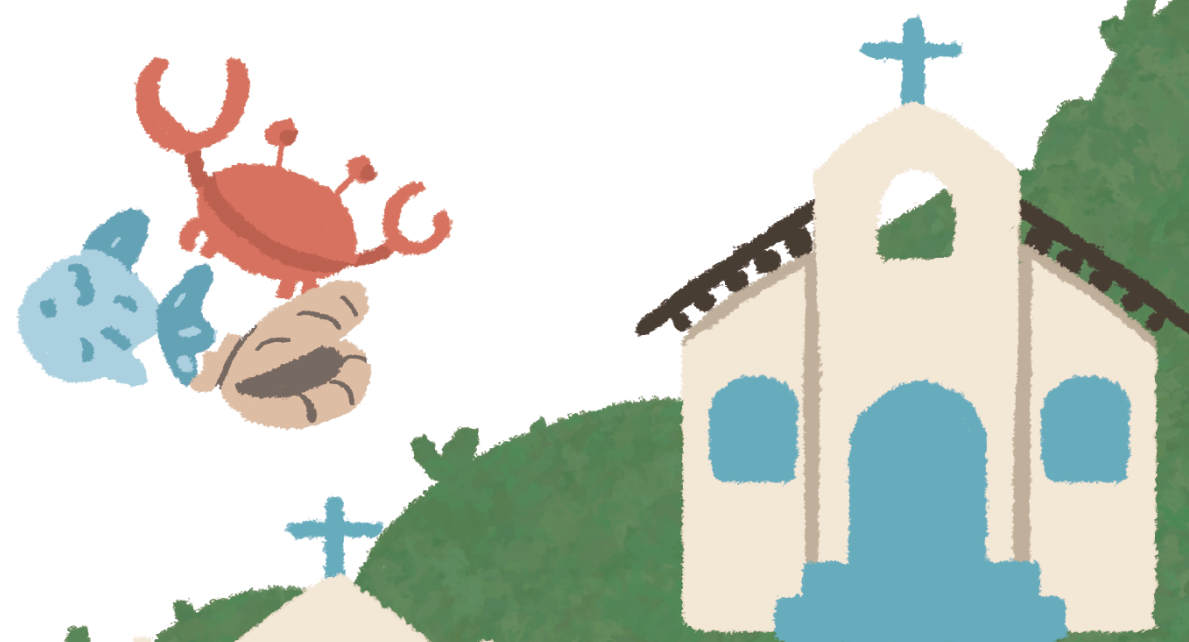
Quilombo do Campinho

A preservação das nossas regiões é muito importante, pois elas possuem grande biodiversidade e abrigam comunidades tradicionais, como as comunidades caiçaras, comunidades indígenas e quilombos.